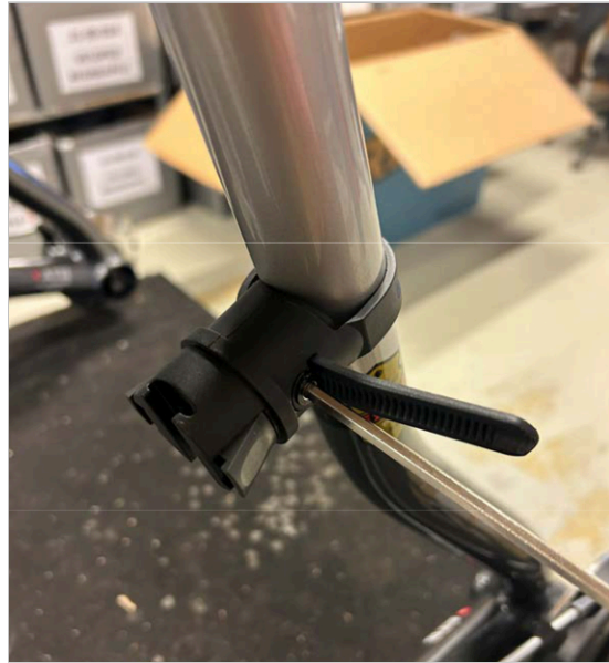
⑥ Ziehen Sie die Schraube/das Band mit dem 4 mm Inbusschlüssel fest, bis das Band straff sitzt.