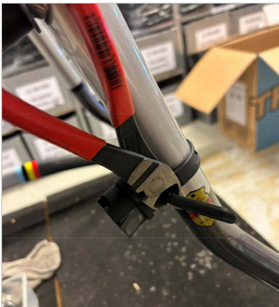
⑦ Schneiden Sie die überschüssige Länge des Bandes mit einem Kabelschneider oder Messer ab.