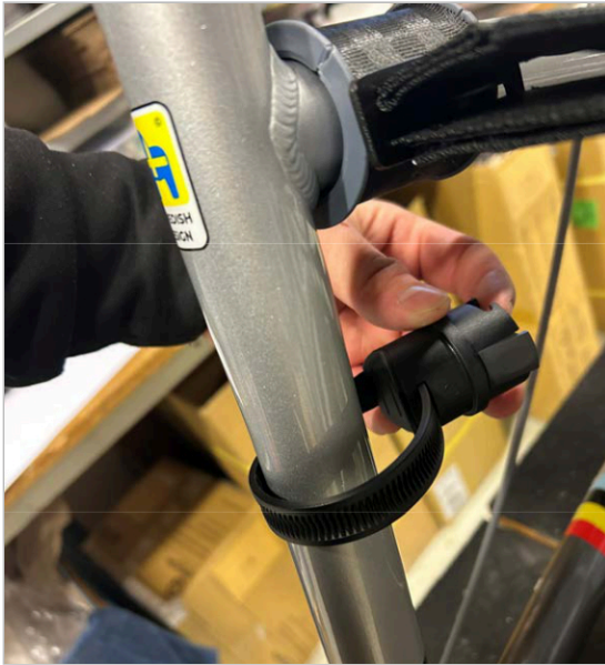
⑤ Führen Sie das Ende des Riemens in die Halterung ein.